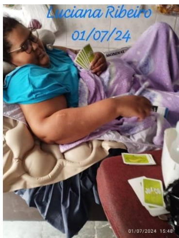
Jogo De Cartas (Mico)