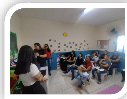
Reunião com Pais

Endereço: Rua Tiradentes nº 398, Bairro Santa Terezinha, São Bernardo do Campo / SP