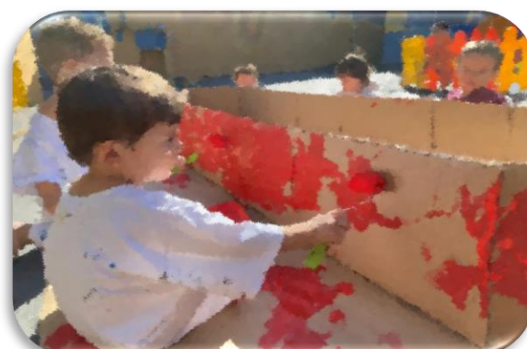
Exploração com tinta

Endereço: Rua Capitão Alberto Mendes Júnior nº 96, Jardim Beatriz, São Bernardo do Campo / SP.