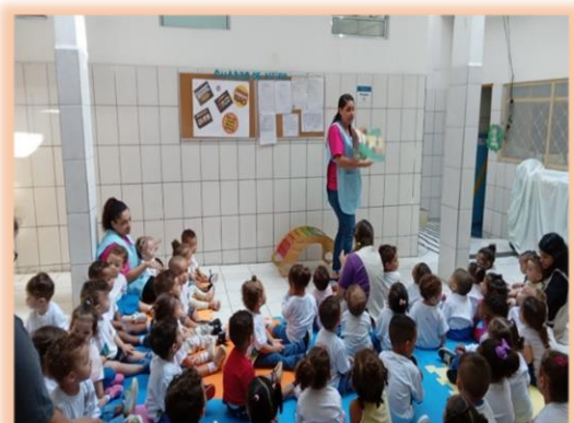
Contação de histórias